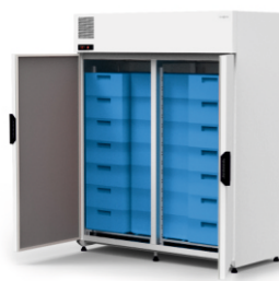
model 21-E2 R-290 / standard