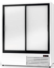
model ZR R-290 / ecoline / standard