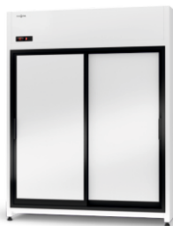
model ZR/AG R-290 / ecoline / standard