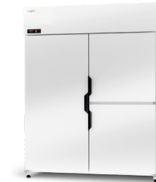
model Z/AG/3D R-290 / ecoline / standard