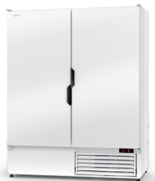
model Z R-290 / ecoline / standard