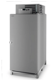
model CARGO R-134A