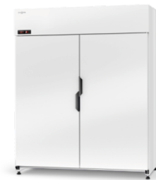
model Z/AG R-290 / ecoline / standard