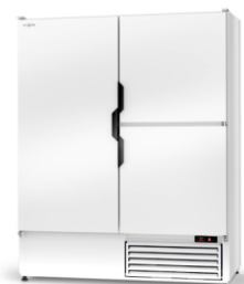
model Z/3D R-290 / ecoline / standard