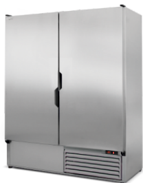
model Z/NZ R-290 / ecoline / standard korpus ze stali nierdzewnej „szlif”