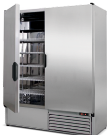
model Z/2N R-290 / ecoline / standard wnętrze ze stali nierdzewnej „lustro” korpus ze stali nierdzewnej „szlif”