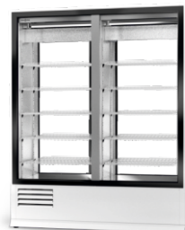
model 2SR/1D; 2S/1D R-290/ ecoline /standard