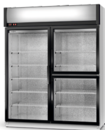
model S/AG/3D R-290/ ecoline /standard