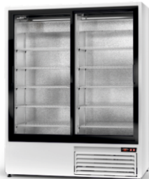
model SR R-290/ ecoline /standard