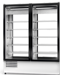
model 2S R-290/ ecoline /standard