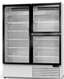
model S/3D R-290/ ecoline /standard