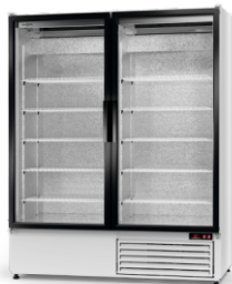
model S R-290/ ecoline /standard