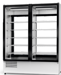
model 2SR R-290/ ecoline /standard