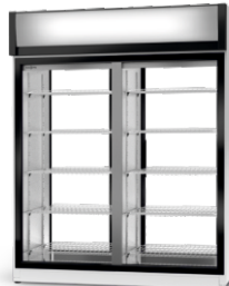
model 2S/AG/1D R-290/ ecoline /standard