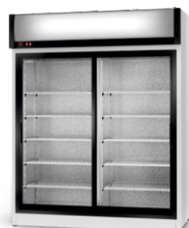
model SR/AG R-290/ ecoline /standard