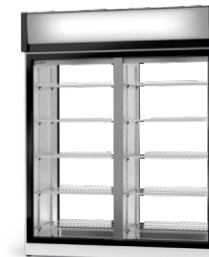
model 2SR/AG/1D R-290/ ecoline /standard