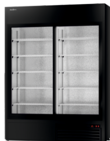
model SR/WH R-290/standard