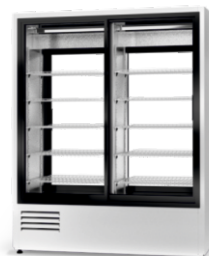
model 2S2R R-290/ ecoline /standard