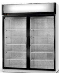
model S/AG R-290/ ecoline /standard